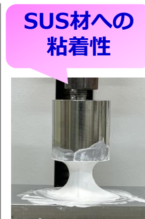
図. 作製ゲルの引張試験(最大応力値)

アルミナ粉10g、水10g、ALGP3gでゲルを作製し、引張試験機で塗工膜をステンレス製治具で挟み込み、引張時の最大応力値。