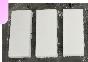
図. アルミナ粉+各試料、100°C乾燥体

アルミナ粉20g、水10g、各試料でゲルを作製し、引張試験機(ミネベアミツミ(株)製、万能試験機)で三点曲げ試験時の最大応力値。